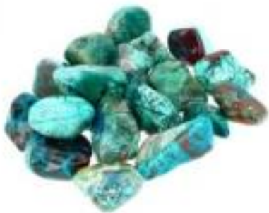
Image non contractuelle - Toutes nos pierres sont naturelles et leurs aspects seront à chaque pièce différente.

La chrysocolle transforme le négatif en positif. Placée à l'intérieure ou autour d'une maison, elle absorbe les énergies négatives. Elle facilite les contacts, renforce l'amitié, calme, purifie les chakras et les charge en énergies positives. C'est la pierre bénéfique et utile dans les moments difficiles à vivre, ou le doute s'installe, aux changements de situations, aux nouvelles relations dont la sincérité est mise en cause. Son rôle est de dissiper toutes énergies négatives, de manière à mettre en harmonie. Placée sur le chakra du cœur, elle intensifie les sentiments d'amour, efface les peines et les chagrins, chakra du 3ème œil, ouvre la perception psychique. C'est une excellente pierre de communication et de méditation.